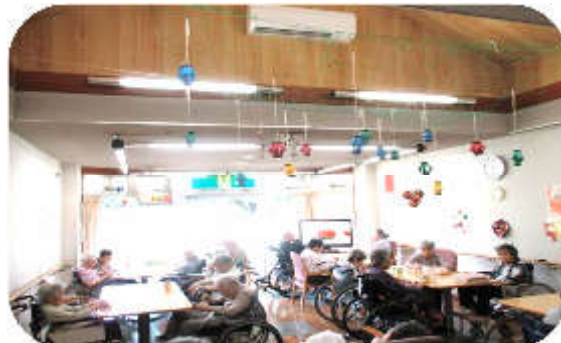
食堂にも飾らせてもらいました