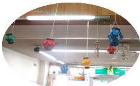
素敵な贈り物をありがとうございます