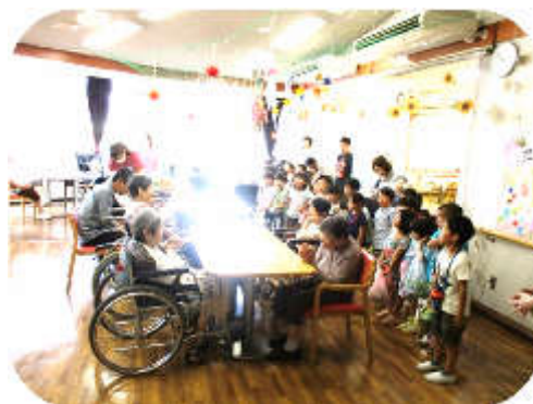
大勢の可愛い園児さん達のご来園