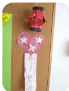
お部屋にもひとつ