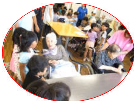
一緒に手遊びしようね