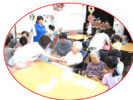
園児の皆さん、先生方ありがとうございます