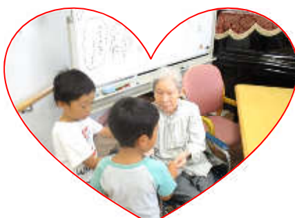
あくしゅ、あくしゅ