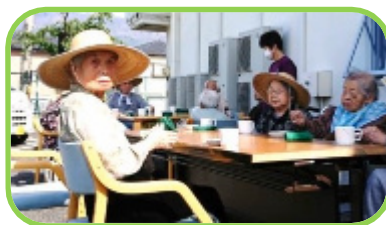
良いお天気でしたね

天気の良い日は、外で桜茶を 皆さんで頂きました。外で飲むお 茶は格別です 会話も弾みます