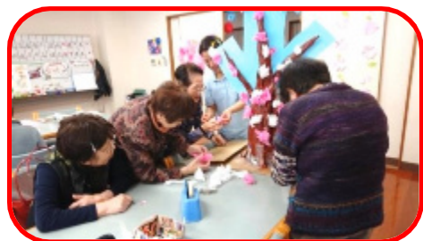
みんなで作ると楽しいですね

天気の良い日は、外で桜茶を 皆さんで頂きました。外で飲むお 茶は格別です 会話も弾みます