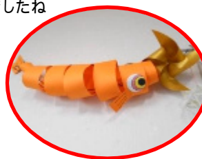
屋根より高～い、 こいの～ぼ～り