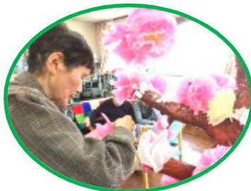
どんどん、咲かせましょう