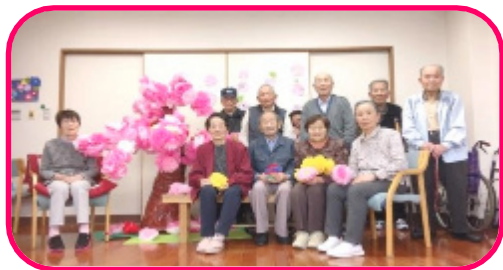
満開な桜と、ハイ、チーズ

今年は平年より桜の開花が早く、そのため予定より花が早く散ってしまい大慌て！！ それならデイサービスに桜を咲かそうということで、ご利用者の皆さんと作りました