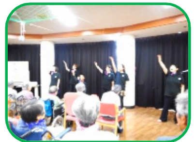
ラベンダーの会の皆様ありがとうございました

5 月 12 日(土)に母の日会を開催しました。ご利用者の皆さんとご家族を招待して、ラベンダーの会の方々による手話を使った歌をご覧いただきました。「世界に 1 つだけの花」や「ふるさと」など 8 曲披露して頂き、手話と踊りを楽しまれました。