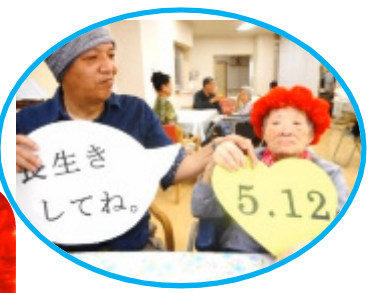
これからも、長生きしてね！！