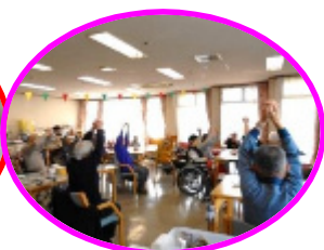
こいのぼり体操を行いま した