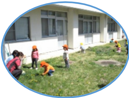
ご利用者、職員へタンポポのプレゼント

4 月は真寿園の近くにある寿保育園の園児の皆さんが、お散歩で真寿園に遊びに来てくれました。元気な声が中庭に響き渡る度、入所者の皆さんは窓から園児が遊んでいる様子を見ながら「かわいいねえ〜」「小さな園児の声を聴くと元気になるね！」と微笑んでいました。これからも気軽に遊びに来て下さいね