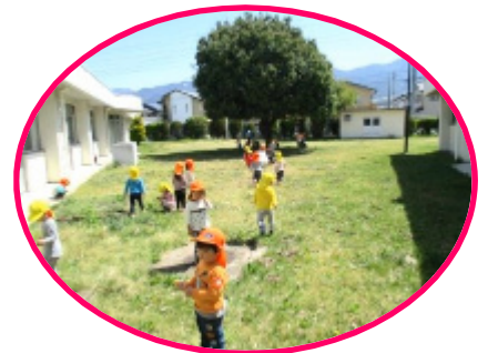
おじいちゃん、おばあちゃん と手を振ってくれました