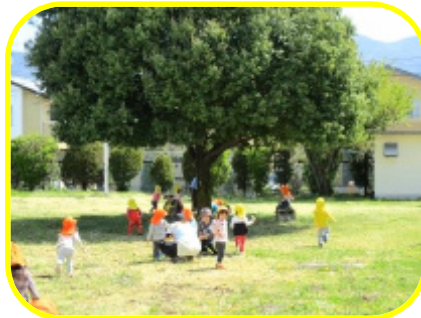
真寿園に元気な声が響き渡ります