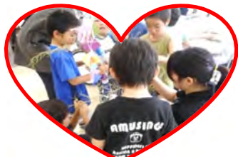
一緒に飾り付け楽しかったです