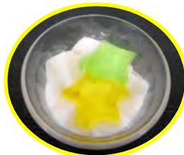
素晴らしい飾りが できました！！