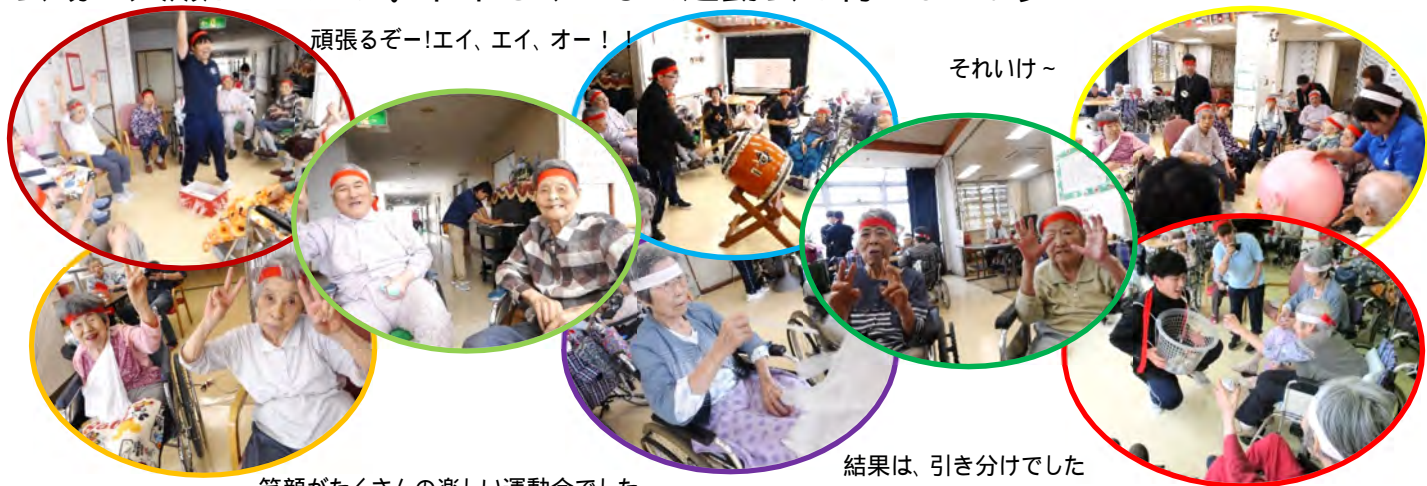
頑張るぞー！エイ、エイ、オー！！

競技は恒例の「大玉送り」「玉入れ」、真寿園オリジナル「紐つなぎりレー」「応援合戦」を行いました。昔の血が騒ぐのか、「それいけ～！」「どンドン投げて！！」と会場は大賑わいでした。来年もみんなで運動会を行いましょう！！