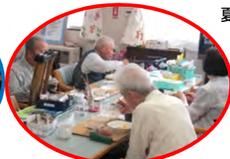
大勢で食べるとおいしいですね