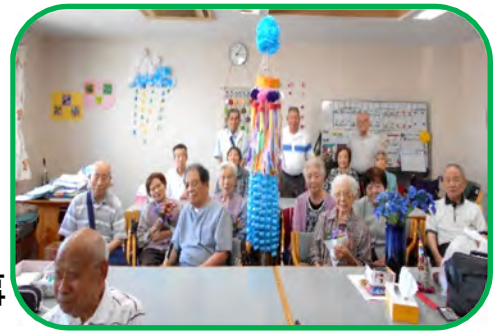
皆さんと一緒に記念撮影

ご利用者の皆さんと七夕飾りを作りました。とても大きな七夕飾りで全長2メートルほどの大作でした。また短冊にこめた願い事も様々で、「健康でいたい」という願いから、思わず笑顔になる微笑ましい願い事までありました。皆さんの願いが叶いますように