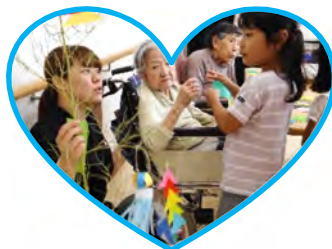
園児の皆さんに癒されました