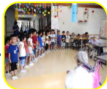
願いが叶いますように シ