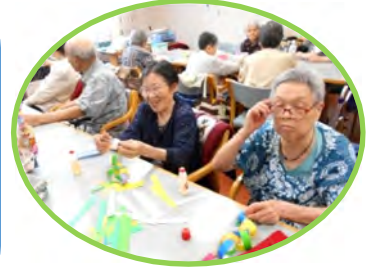
ご協力ありがとうございました