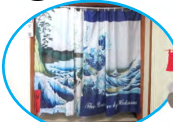
富嶽三十六景の暖簾をくぐれば

デイサービスの浴室新築工事が無事に終了し、現在ご利用者の皆様に利用していただいています。これからも真寿園のお風呂を楽しんでいただきたいと思います。🌀せっかくなので、皆さんにもご覧いただきたいと思います。