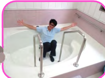
皆さん、くつろいでくださいね