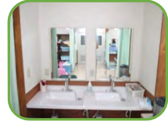
身だしなみもパッチリ！！