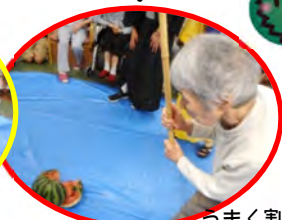
うまく割れました

午前中は盆踊りにスイカ割りといったプログラムで、スイカ割りは「もっと右、真っすぐ！もっと！！」「そこ、そこ、そらいけえ～！」と歓声と笑いで大賑わいでした