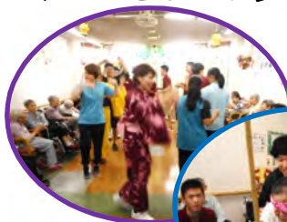
盆踊りを踊りました

午前中は盆踊りにスイカ割りといったプログラムで、スイカ割りは「もっと右、真っすぐ！もっと！！」「そこ、そこ、そらいけえ～！」と歓声と笑いで大賑わいでした