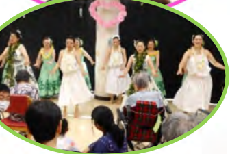
ハウラ・フラエ・ホーナニナプアの皆様ありがとうございました