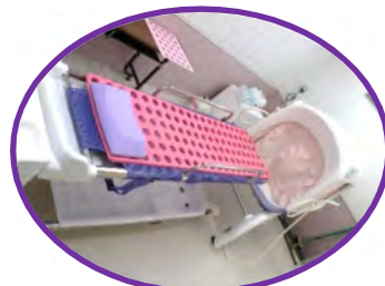
寝たまま、ミスト浴 体はポッカポカ