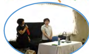
ありがとうございました！