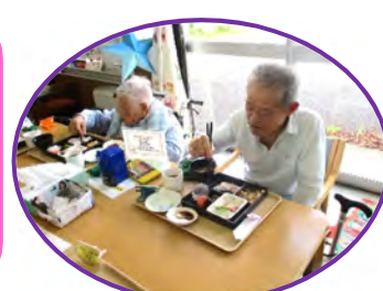
とても好評でした