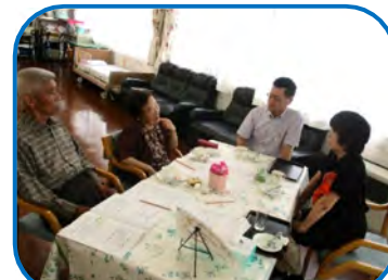
ご参加ありがとうございました