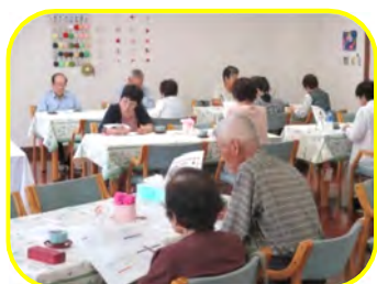
これからもいろんな情報を発信していきたいと思ひます