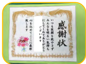
これからもお元気にお越しください 職員一同