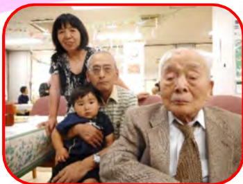
背広姿が素敵ですね

これからもご利用者の皆様に益々お元気で楽しい毎日をお過ごし頂けるように、精一杯応援させて頂きたいと思います。😊