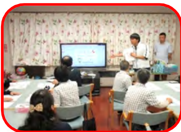
ご参加ありがとうございました！！

10月24日に「ゆきもかえりも こたけ」でお馴染みの洋服・用品のこたけさんと真寿園の新人職員を対象に認知症サポーター養成講座を開きました。認知症サポーターとは、なにか特別なことをやる人ではありません。認知症を正しく理解し、偏見を持たず、認知症の人やそのご家族に対して、「温かい目で見守る応援者」です。認知症のことを正しく理解することで、ご本人もご家族も安心した生活が送れます。こういった講座を開きながら、地域の皆さんと一緒に支えていきたいと思っております！！