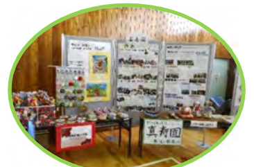
真寿園のブースです！