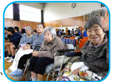
賑やかで楽しいですね

11月10日に寿地区文化祭にご利用者の皆様と一緒に参加しました。この文化祭は7年目を迎えました。地域の皆さん、近隣小・中学校の生徒の皆さん、地域の各団体、近隣施設が参加されました。真寿園は施設の紹介ブースに加えご利用者の皆様が一生懸命作った作品を展示しました。開会式では2か月かけて作ったくす玉を割り、各団体の発表等を鑑賞し、セラミックボールの足湯体験なども体験しました。地域と皆さんと触れ合うとても楽しい時間でした。また来年も参加したいと思っております。