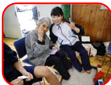
セラミック足湯はあったまるね