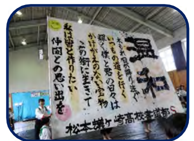
書道パフォーマンス 感動しました