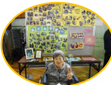
とてもおもしろかったです