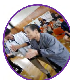
一緒に体を動かしました！！