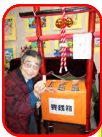
良い年になりますように

皆さんで、書初め、すごろく、福笑いなど懐かしい正月遊びをしながら過ごしました。今年も良い笑顔がいっぱいな年でありますように 😊