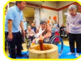
ヨイショー！ヨイショー！