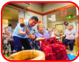
おいしいお餅にな～れ！

1月7日に「新年会」を行いました。毎年恒例の餅つき大会を行いました。一昔前は、時期になると外で臼と杵で餅つきをしている光景を多く目にしていましたが、最近では見かけることが少なくなりました。ご利用者の皆様と職員は久しぶりの餅つきで大盛り上がり、杵の動きに合わせて「ヨイショー！ヨイショー！」元気な掛け声をかけてくださいました。それを聞きつけたデイサービスのご利用者様も、一緒に参加され、皆さんで一生懸命ついてくれました