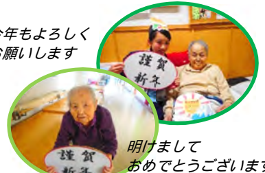
明けまして おめでとうございます！