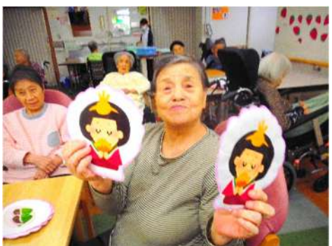
この貝、私が取りました!!