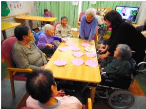
あの絵、どこかで見たような気が

3月4日(水)に「ひな祭り会」を行いました。ご利用者の皆様と一緒にひな祭りの歌を歌いました。そしてゲームでは「貝合わせ」を行いました。「さっきみた気がするな、どこだったかな?」「揃った! やっぱり思ったとおり」「違うよ、そこそこ!」などと大盛り上がりでした