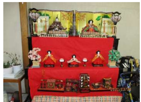
こちらでも貝合わせ、あの絵どこかで見たような...