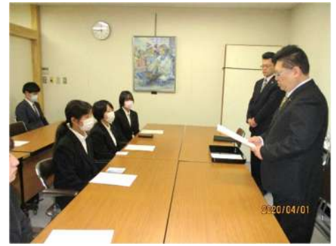
皆さん、真剣に聞いています