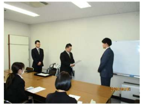
皆さん、これからよろしくお願ひします