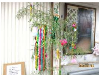
短冊に願いを込めました

デイサービスでは七夕週間に、ご利用者の皆さんと七夕飾りとウチワを作りました。2メートルほどの笹に短冊を飾り付けて願い事をしました。皆さんの願いが叶いますように。ウチワ作りは色とりどりの紙テープを組み合わせて世界に一本しかないウチワを作りました。