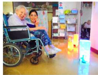
優しい光にやされますね