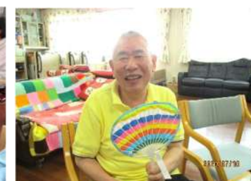
世界に一本のウチワができました!!