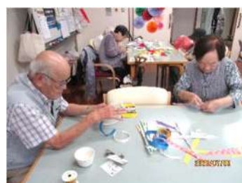
ウチワづくりに皆さん真剣です。