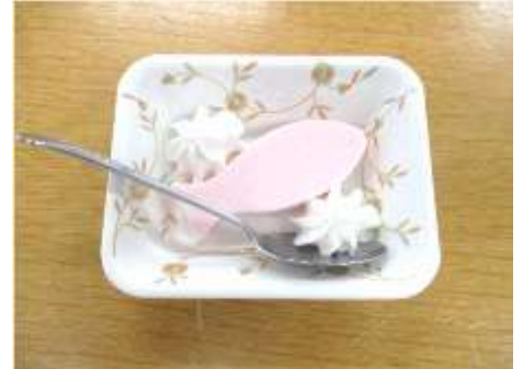
真寿園特製「鯉のぼりパバロア」

今年もデイサービスの外では真寿園農園を始めました。トマトにキュウリにかぼちゃの苗を畑に植えました。今年もたくさん採れるといいですね!!