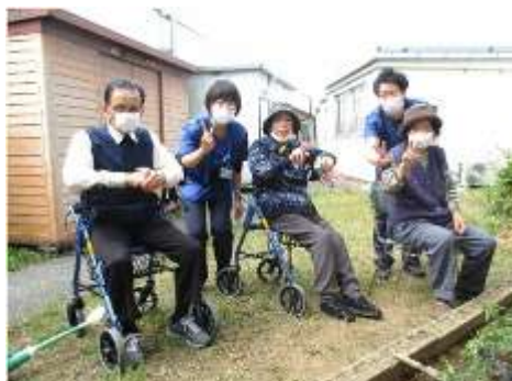
皆さん満足そうな笑顔です