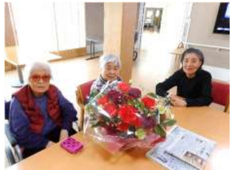
花を囲んで・・・きれいですね