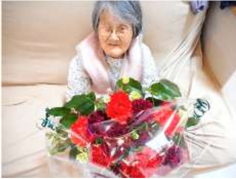
お花と一緒に パチリ

5月13日(木)に母の日会を行いました。日頃の感謝をこめて花束が届きました。みんなで「母の日」にちなんだ歌を歌い、体操やレクリエーションをしました。きれいなカーネーションを前に皆様と楽しいひと時を過ごしました。来年もぜひ皆さんお元気で、「母の日会」をご家族・職員とお祝いしたいと思います。