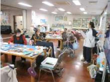
う～ん？ クイズ回答中です

5月2日(日)から5月8日(土)まで鯉のぼり週間を実施しました。端午の節句や鯉のぼりにちなんだ歌をみんなで歌ってお祝いをした後、クイズで盛り上がりました。おやつは鯉のぼりにちなんだおやつが出されました。