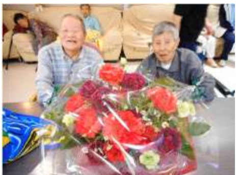
男性も花と一緒にハイチーズ