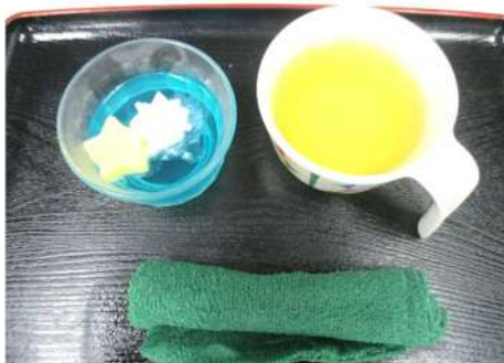
おやつは七夕ゼリーです♡