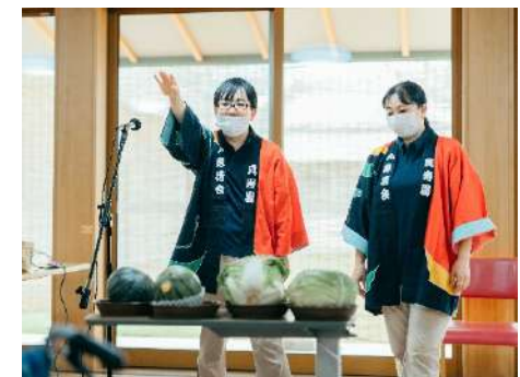
一番重い野菜はどれでしょう？