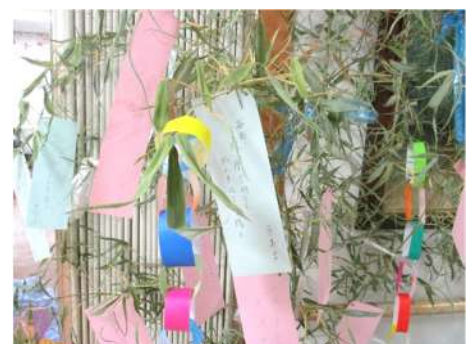
沢山願い事をしました♡