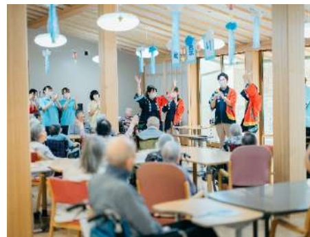
ほんぽん松本ほんぽんほんぽん～♪