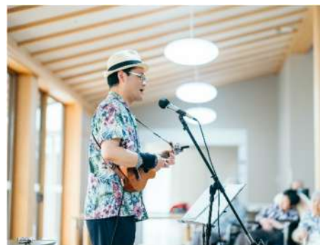
夏が来れば思い出す～♪