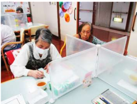
短冊に願いを込めました